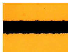
例：Si 工件的崩边比较